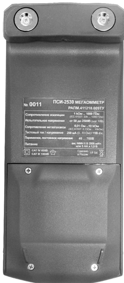
Рисунок 4 – Общий вид мегаомметров ПСИ-2530. Вид сзади