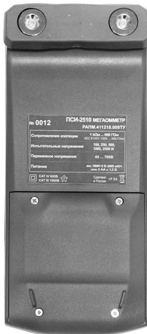
Рисунок 2 – Общий вид мегаомметров ПСИ-2510. Вид сзади