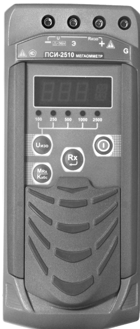
Рисунок 1 – Общий вид мегаомметров ПСИ-2510. Вид спереди

Общий вид мегаомметров представлен на рисунках 1 – 4. Схема пломбировки от несанкционированного доступа представлена на рисунке 5.