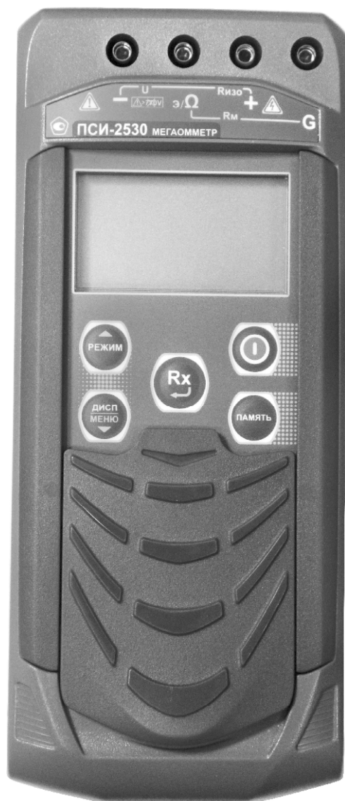
Рисунок 3 – Общий вид мегаомметров ПСИ-2530. Вид спереди